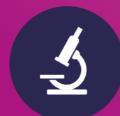
Mens & natuur