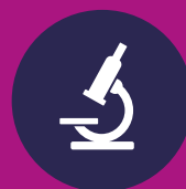
Mens & natuur