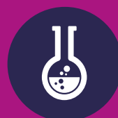
Natuur & techniek